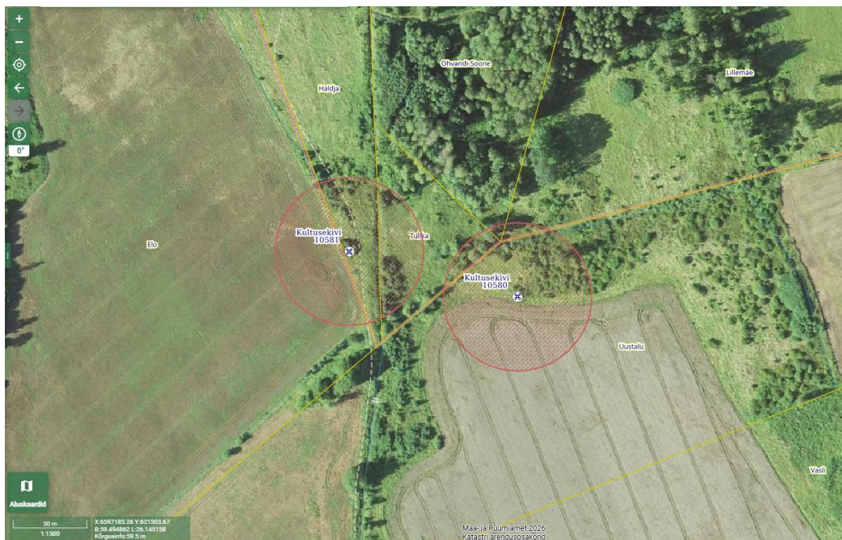
Lisa 3. Kultusekivi reg-nr 10581 asukoht ja kaitsevöönd Maa- ja Ruumiameti kultuurimälestiste kaardikihil seisuga 15.05.2026. (Alus: Maa- ja Ruumiameti geoprtali kultuurimälestiste kaardikiht)